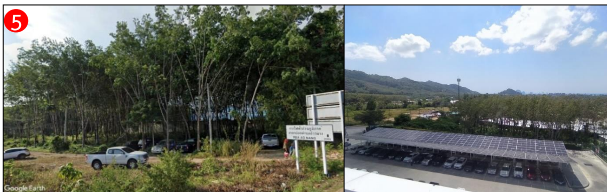
ทิศใต้ ติดกับ ที่ดินบุคคลอื่น ปัจจุบันเป็นสวนยางพารา