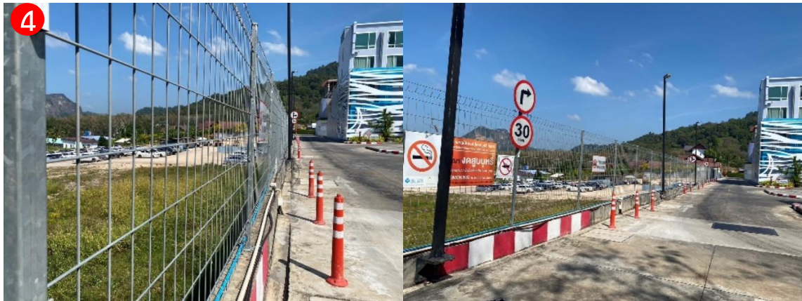
ทิศตะวันตก ติดกับพื้นที่จอดรถ ซึ่งเป็นที่ดินของโรงพยาบาล